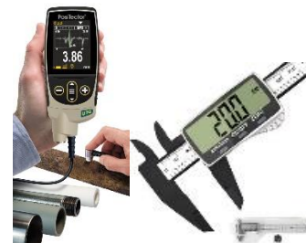
Medidor de espesor

Dentro de este equipamiento incluimos: - TF008A Medidor de espesor - TC008B Calibre digital - TC008C Escaner 3D Se considera necesario que haya al menos 2 de estos equipamientos para cumplir con el requisito.