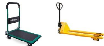
Carro de transporte Transpalet

Se incluyen en este concepto: - TF007A: Carro de transporte - TF007B: Transpalet - TF007C: Polipasto - TF007D: Grúa Se recomienda que tanto transpalet como grúa soporten hasta 2 Tm de peso. Se recomienda que el polipasto soporte hasta 500 kg de peso. Se considera necesario que haya al menos 2 de estas máquinas para dar por cumplido el requisito de disponer de maquinaria de transporte.