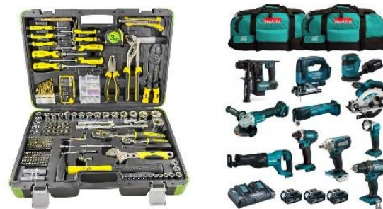
Herramientas manuales Herramientas eléctricas

Se considera necesaria la presencia de todos estos elementos para cumplir el requisito.